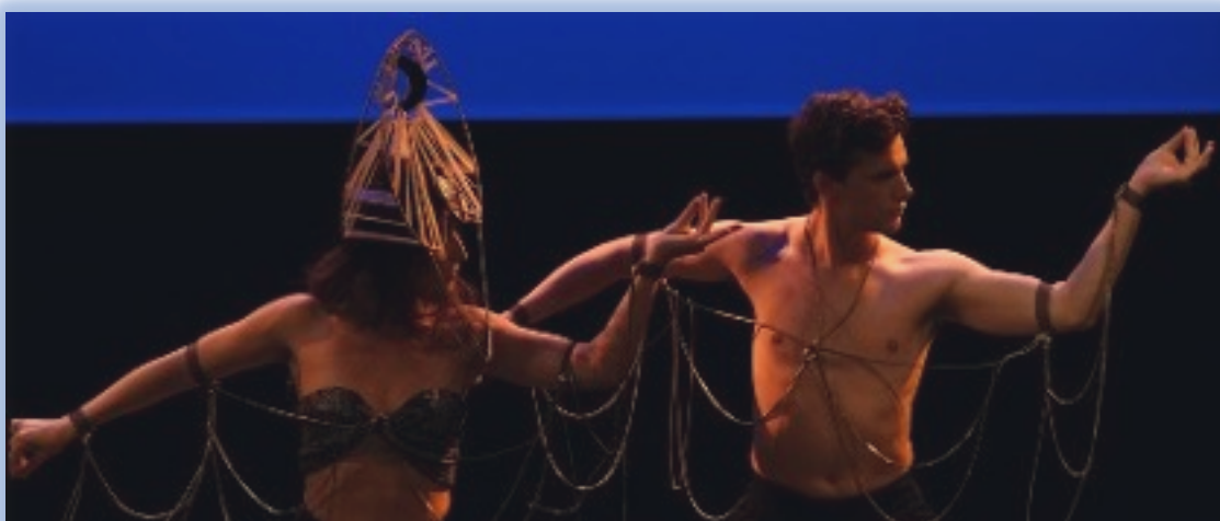
Voyage en Inde

Tant d'autres questions n'ont pas encore leur réponse... Peut-être les avez-vous ?