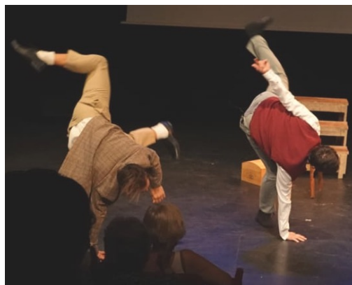
Universal Studio - Singing in the Rain